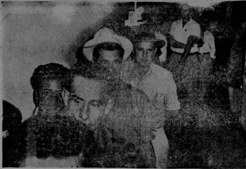
Puede observarse en la gráfica la larga fila de ganaderos que se formó esta mañana en el Ministerio de Agricultura y Ganadería a fin de obtener la orden necesaria para obtener alimentos para el ganado. Estos ganaderos han resultado perjudicados por la actividad volcánica del Irazú.

Usted debe hacerse junior, porque la Cámara Junior cree que la hermandad de los hombres trasciende a la soberanía de las Naciones.