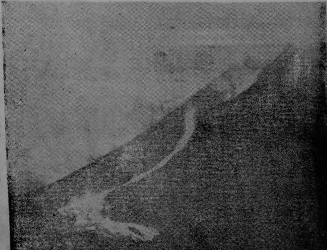
El Monte Etna vomita lava. Mayo 18 (AP). Una candente lengua de lava se desliza del cráter central del volcán más alto de Europa, el Monte Etna. Esta foto, tomada al alba de ayer, muestra el avance de la roja lava

por la falda Sur del volcán. La erupción del Etna, cerca de Messina, Sicilia, atrajo a numerosos turistas y curiosos de todas partes de Italia.