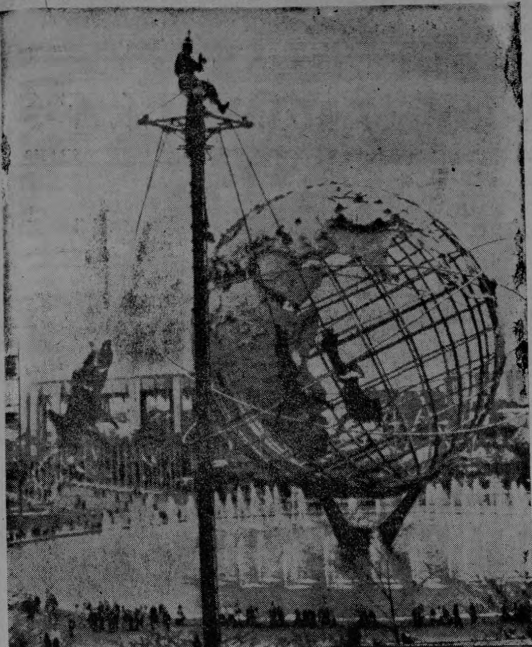
FERIA MUNDIAL, NUEVA YORK, 16 (AP) Los visitantes a la Feria Mundial hoy presenciaron una actuación especial de los Voladores Mexicanos. Los Voladores subieron a un poste de 35 metros de alto y dieron vuel