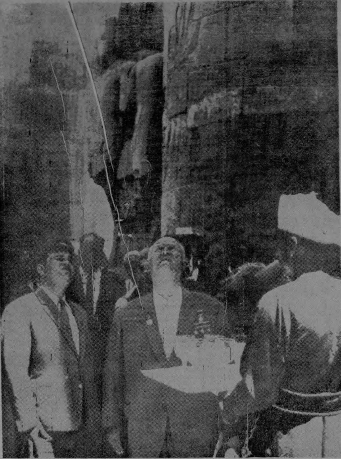
LUXOR, EGIPTO, 18 (AP). El Primer Ministro soviético Nikita Kruschchev, mira al techo del templo Karnal en Luxor, Egipto, mientras un intérprete le transmite las explicaciones, y un sirviente le ofrece refrescos.